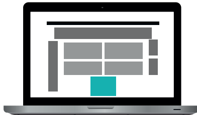
Jättiboksi 468 x 400 px 45 €