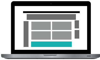
Jättibanneri 728 x 90 px 65 €