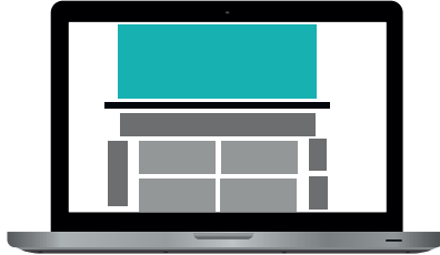
Paraati 980 x 400 px 95 €