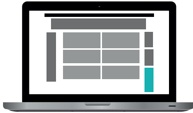
Pidennetty suurtaulu 160 x 600 px 85 €