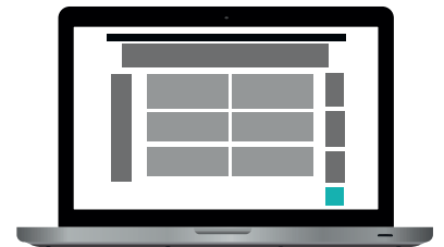
Painike 150 x 150 px 35 €