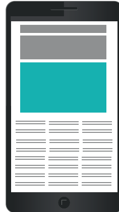
Mobiilipanorama 300 x 150 px 75 €