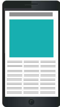
Mobiiliboksi 300 x 250 px 85 €