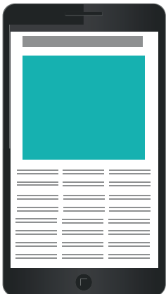
Mobiiliparaati 300 x 300 px 95 €