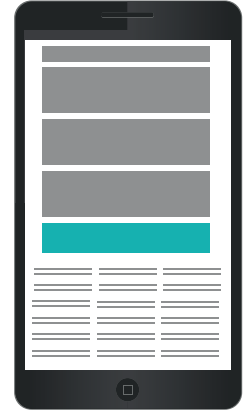
Kalapuikko 300 x 75 px 45 €